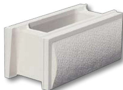
Muretti Evolution Bianco antico / Tono pietra