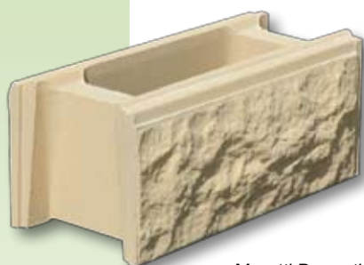
Muretti Bugnati Bianco antico / Tono pietra

La soluzione semplice e rapida per abbellire ed arredare il vostro giardino