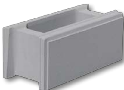
Muretti Lisci Bianco antico / Tono pietra / Grigio

I muretti Weser sono la soluzione ideale per costruire rapidamente dei muri di cinta, dei muretti e dei decori da giardino : posati a secco su una soletta di cemento questi blocchi cavi ispirati alla pietra tagliata necessitano semplicemente di essere riempiti di un calcestruzzo magro. Con un solo intervento il muro è montato : non ci sono giunte da fare né intonaco né rivestimenti da applicare. Per il professionista è un risparmio di tempo importante poiché non è necessario ritornare più volte sul cantiere. Per i non professionisti è la sicurezza di una bella realizzazione senza il savoir faire del muratore.