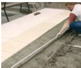
Preparazione della malta prima della posa.