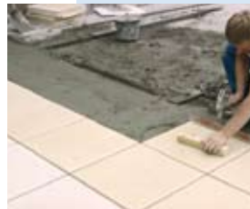
Aggiustamento delle lastre.