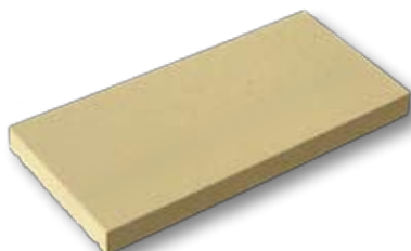
CHR0 - Copertina piatta