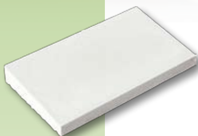
CHR1 - Copertina a 1 pendenza

La scelta della larghezza della copertina è determinata dalla larghezza del muro intonacato finito. I copripilastri e copertine sono muniti di sgoccia-acqua.