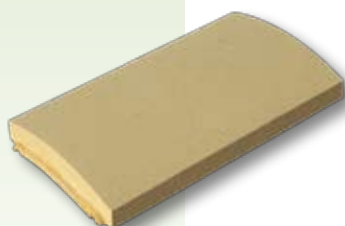
CHR3 copertina arrotondate con incastro