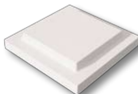
CP0 - Copripilastro piatto