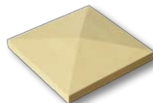
CP4 - Copripilastro a 4 pendenze