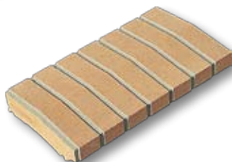
CHR JP2 - Copertina finto mattone